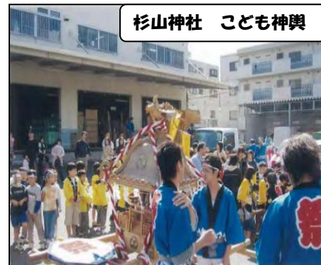
杉山神社 こども神輿