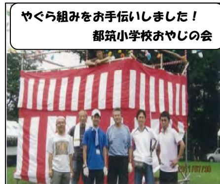
やぐら組みをお手伝いしました！ 都筑小学校おやじの会