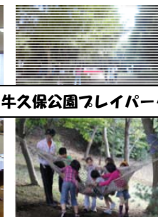
牛久保公園フレイパーク