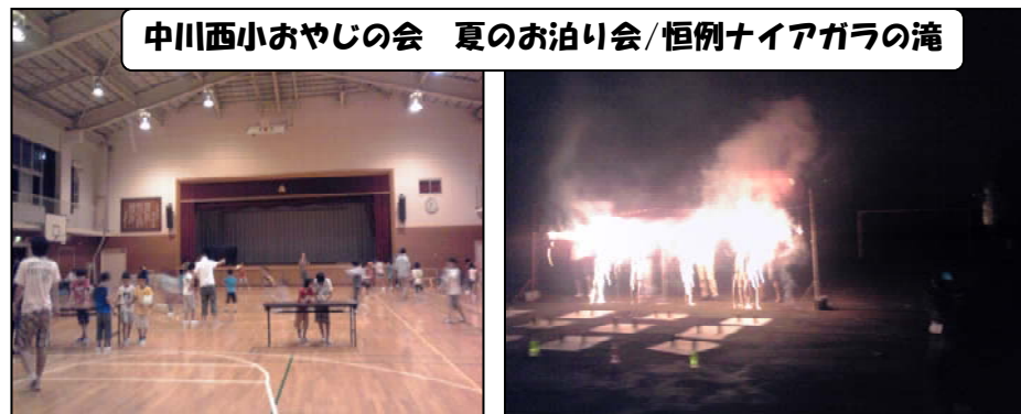
中川西小おやじの会 夏のお泊り会/恒例ナイアガラ滝