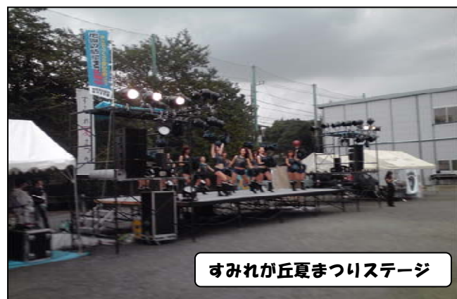
すみれが丘夏まつりステージ