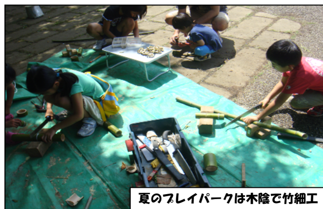
夏のフレイパークは木陰で竹細工