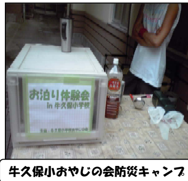
牛久保小おやじの会防災キャンプ