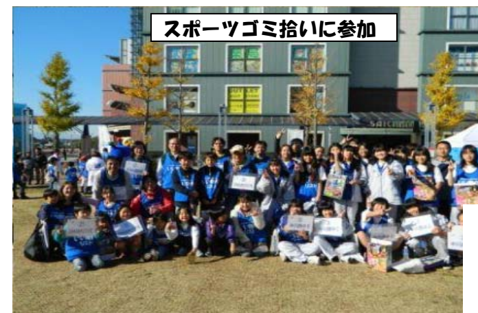
スポーツゴミ拾いに参加