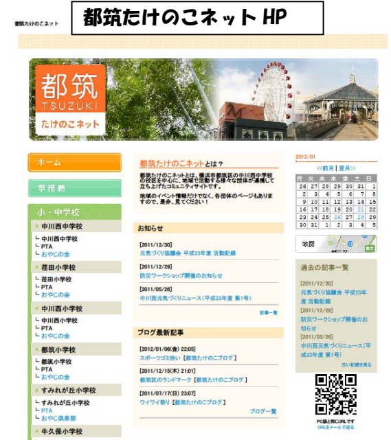
都筑たけのこネット HP