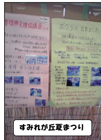
すみれが丘夏まつり