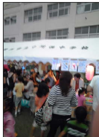
すみれが丘夏まつり