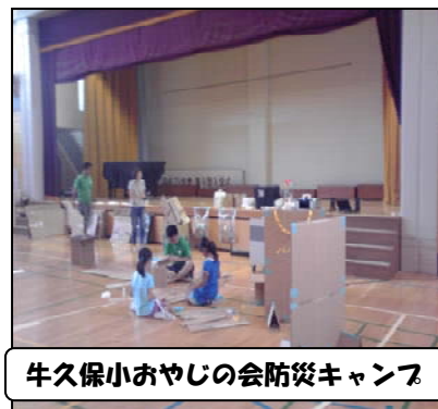
牛久保小おやじの会防災キャンプ